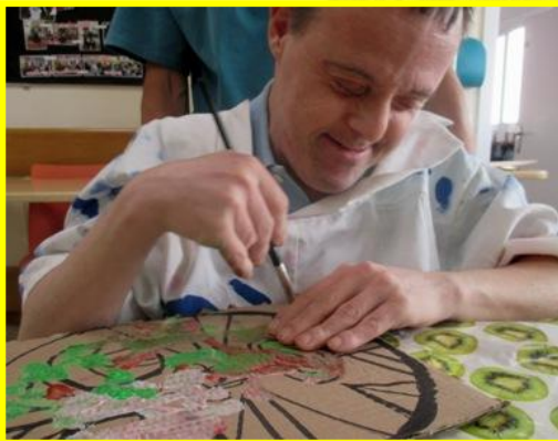
TALLER DE MÀSCARES