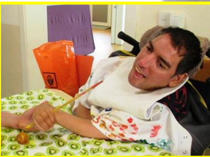
TALLER DE CERÀMICA