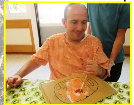
TALLER DE MÀSCARES