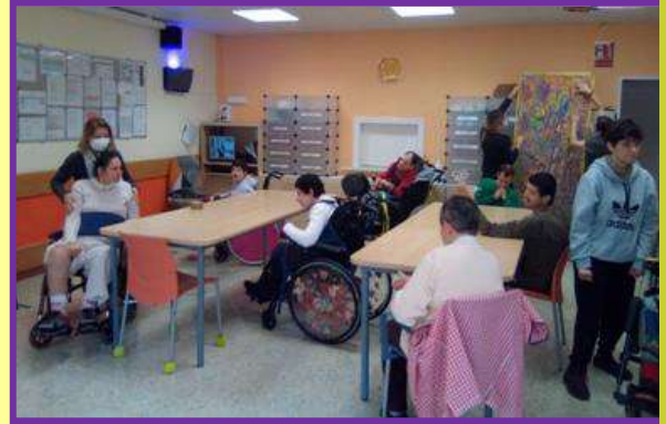
Totes plegades hem confeccionat el cartell commemoratiu del Dia de la Dona! Moltes Felicitats a totes!